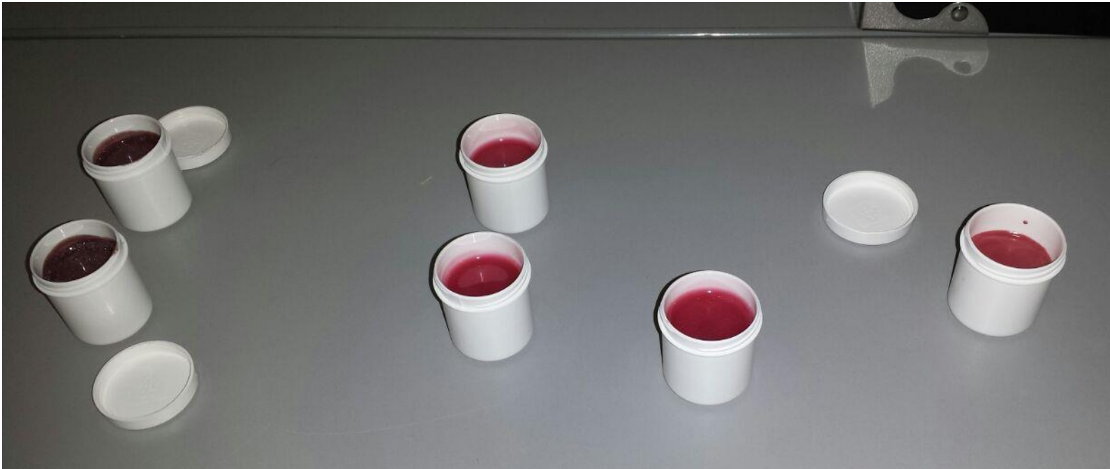
Lipgloss in verschiedenen Farbtönen...